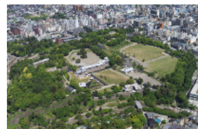
特定テーマ部門 金沢城公園