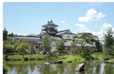
第32回 国土交通大臣賞 受賞作品