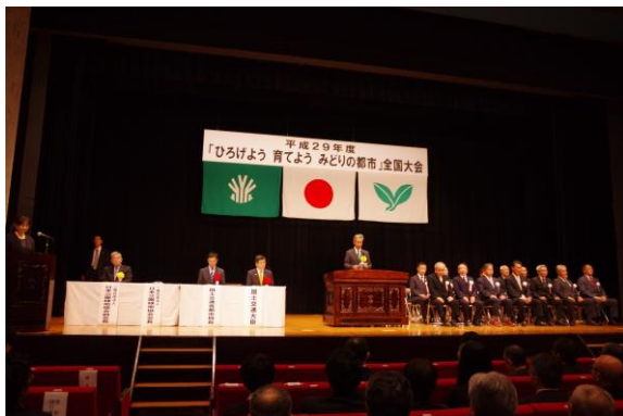
全国大会 開会の様子