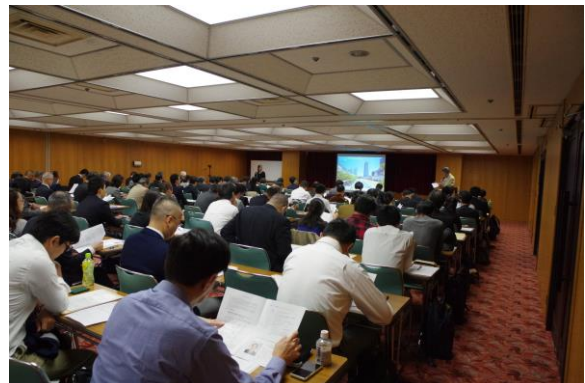
事例発表会の様子

平成30年度は、10月26日（金）に、29年度と同様、東京・日本消防会館（ニッショーホール）において、全国大会を開催いたします。 皆様のご参加をお待ちしております。