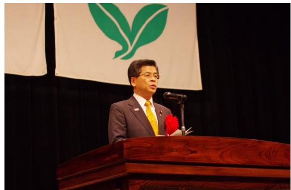
石井 国土交通大臣の祝辞