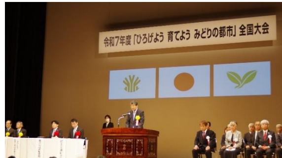
第二部 全国大会 開会挨拶