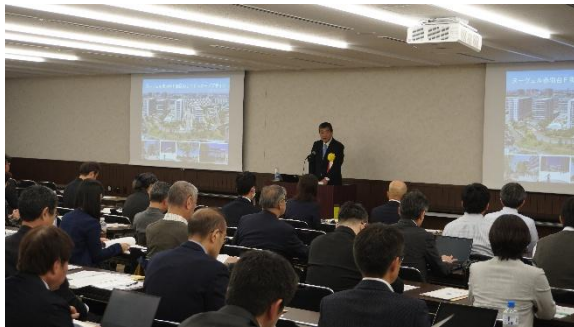
第一部 事例発表会 開会挨拶