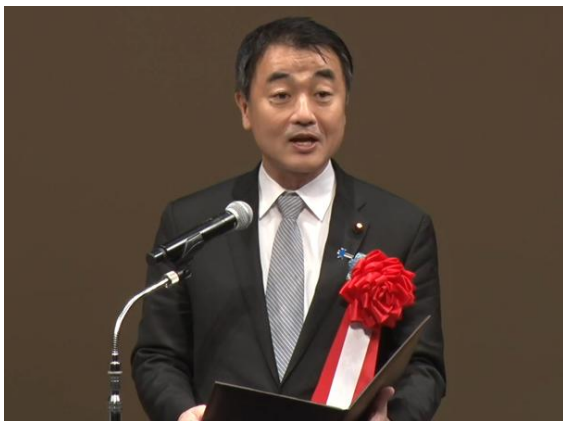
国土交通副大臣 佐々木 紀様の祝辞